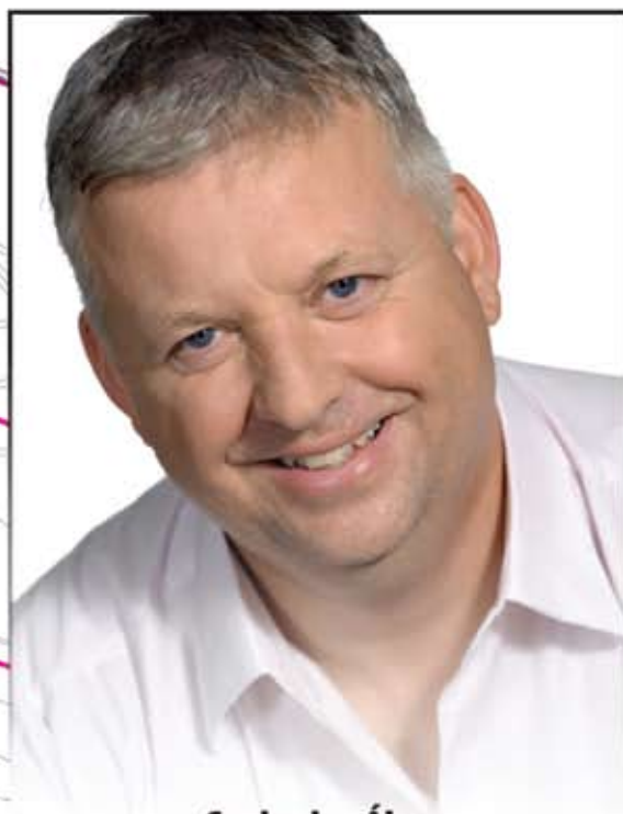
Szabados Ákos Polgármesterjelölt, képviselőjelölt 10. választókerület