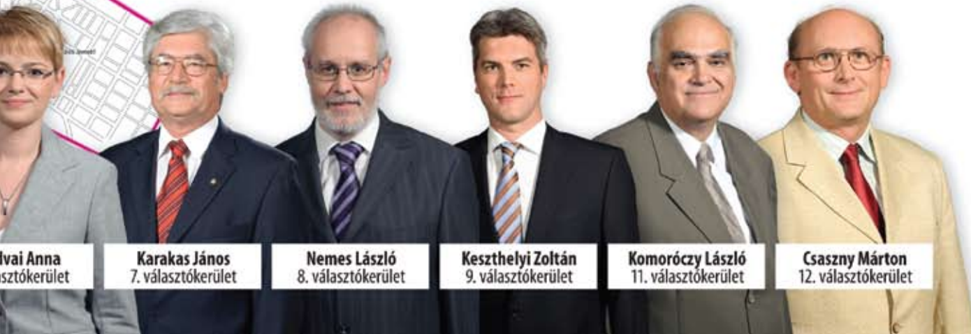
Ivai Anna választókerület